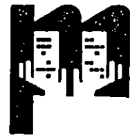
香港物業管理公司協會 The Hong Kong Association of Property Management Companies