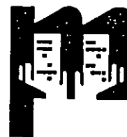
香港物業管理公司協會 The Hong Kong Association of Property Management Companies