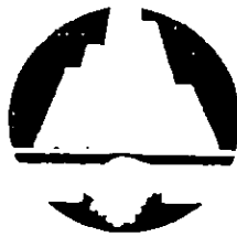
香港地產行政學會 Hong Kong Institute of Real Estate Administration