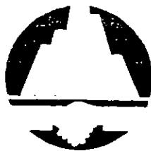
香港地產行政學會 Hong Kong Institute of Real Estate Administration